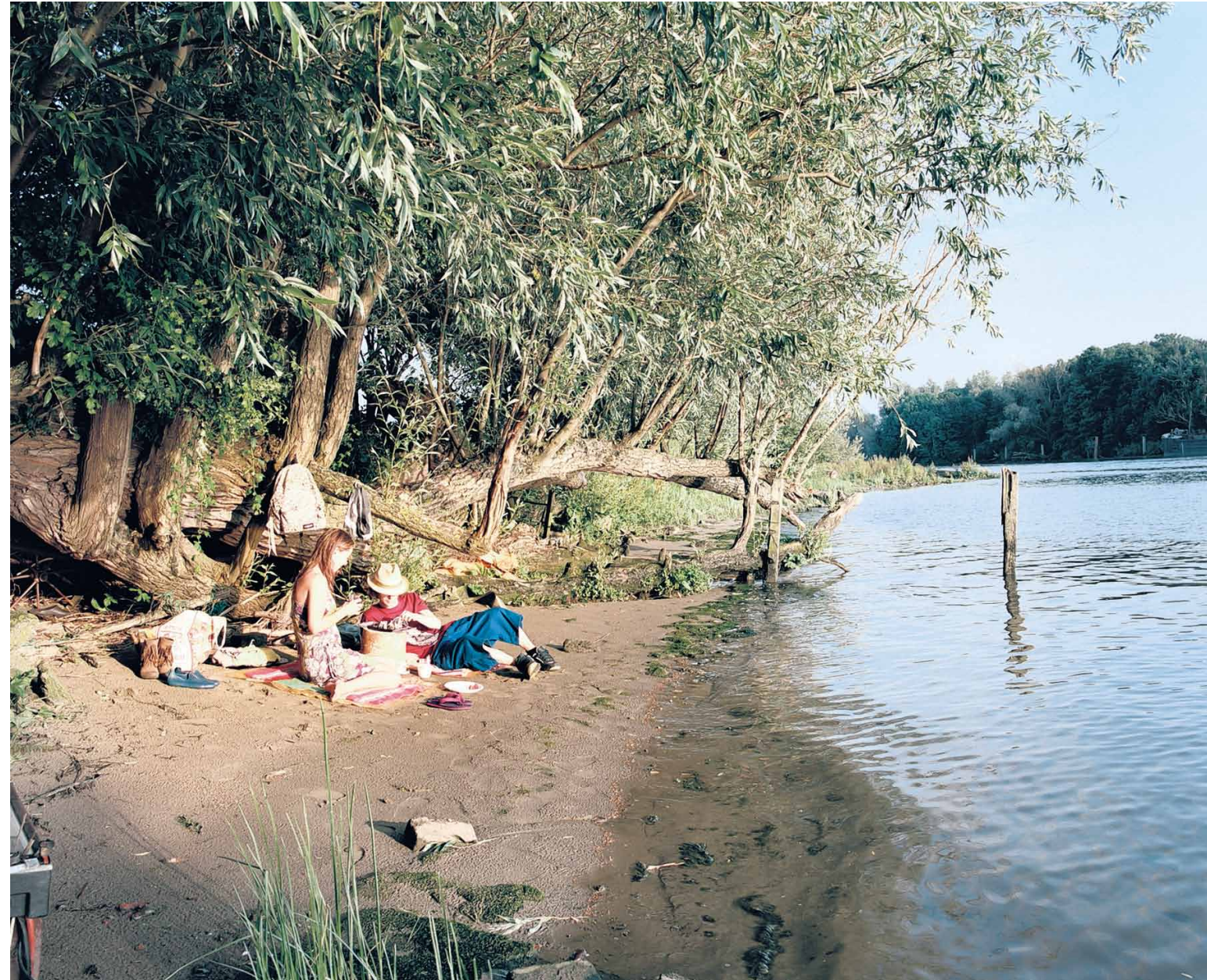
Een stelletje picknickt tijdens het afscheidsfeest van de Sophiapolder op het strandje dat alleen droogvalt met eb.

De Chinese tak van Friends of Nature voert al langer actie tegen de luxueuze uitspattingen. Voor jaar gepubliceerde de organisatie een rapport over het water- en elektriciteitsgebruik in sauna's en zwembaden. Volgend jaar wordt de golfindustrie onder de loep genomen.