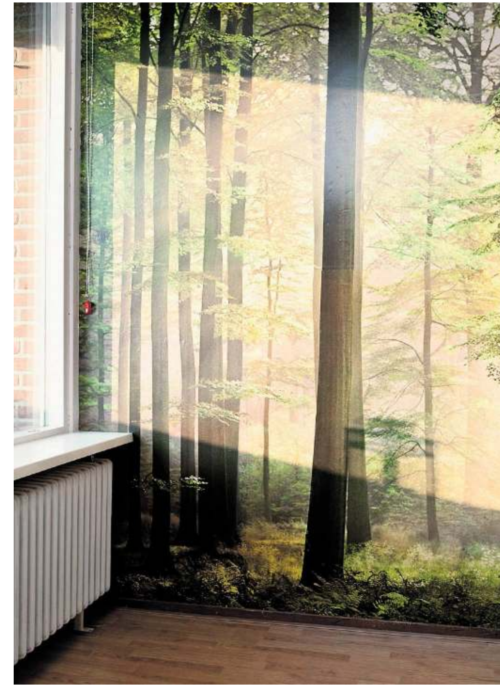
Beeld uit het boek Plastic Panda's .